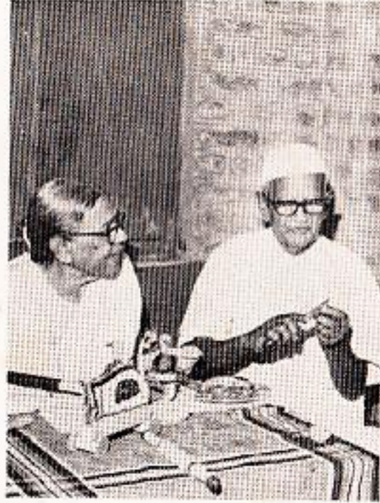
' सरकारी किताब घ्यायला जायला आम्हाला वेळ कुठे आहे ? '